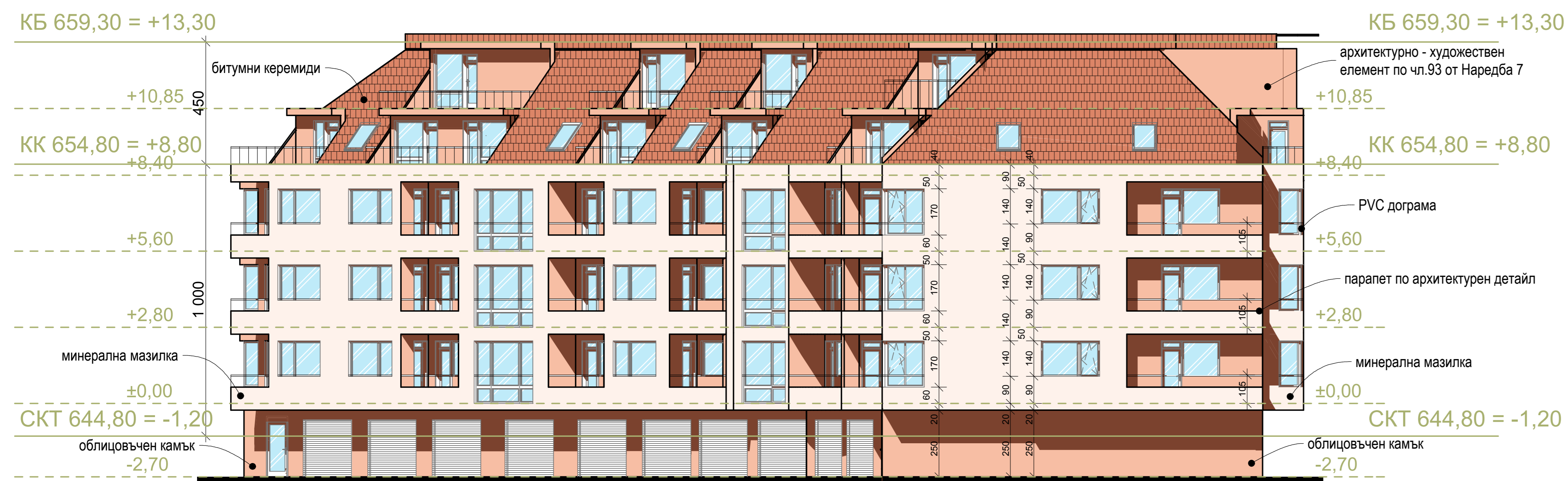
ФАСАДА СЕВЕР, М 1:100