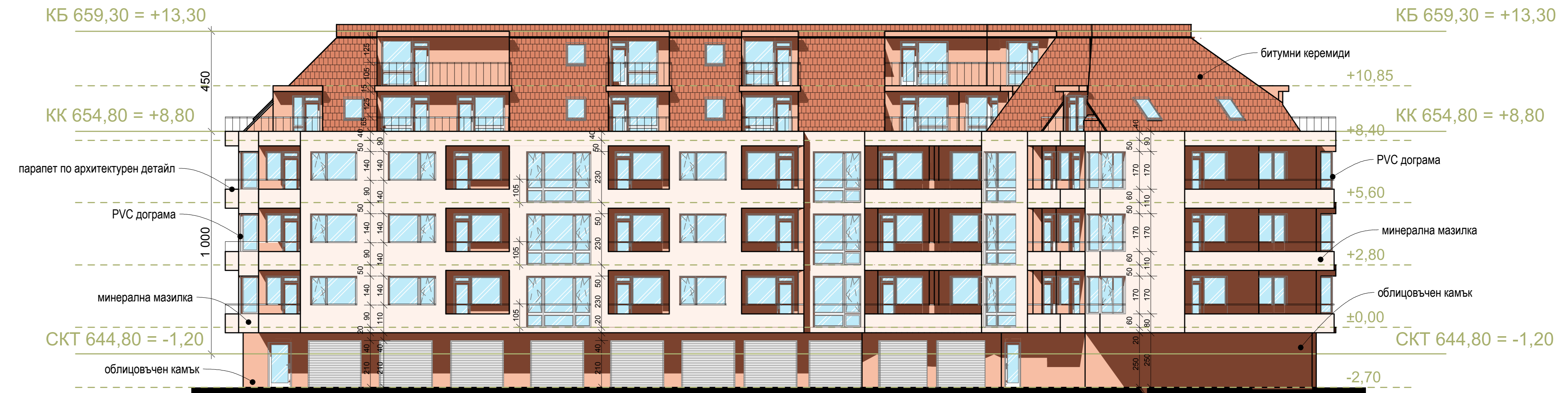
ФАСАДА ИЗТОК, М 1:100